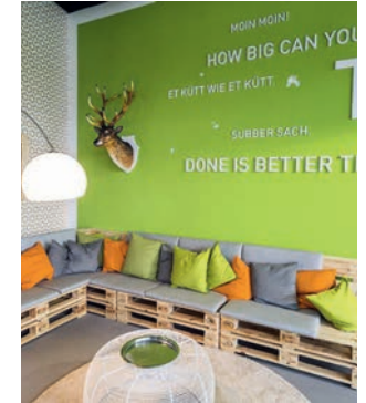
Reise-Stationen im Energie-Campus 2020

» Die Transformation der Energiewirtschaft verändert die Rolle des HR-Experten, macht ihn zum HR Digital Manager. «