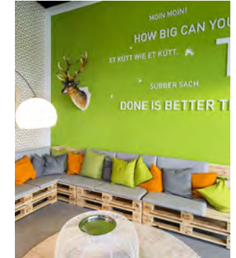
Unsere Campus-Locations mit der passenden Atmosphäre für NWoW und Transformation

» Die Transformation der Energiewirtschaft verändert die Rolle des HR-Experten, macht ihn zum HR Digital Manager. «